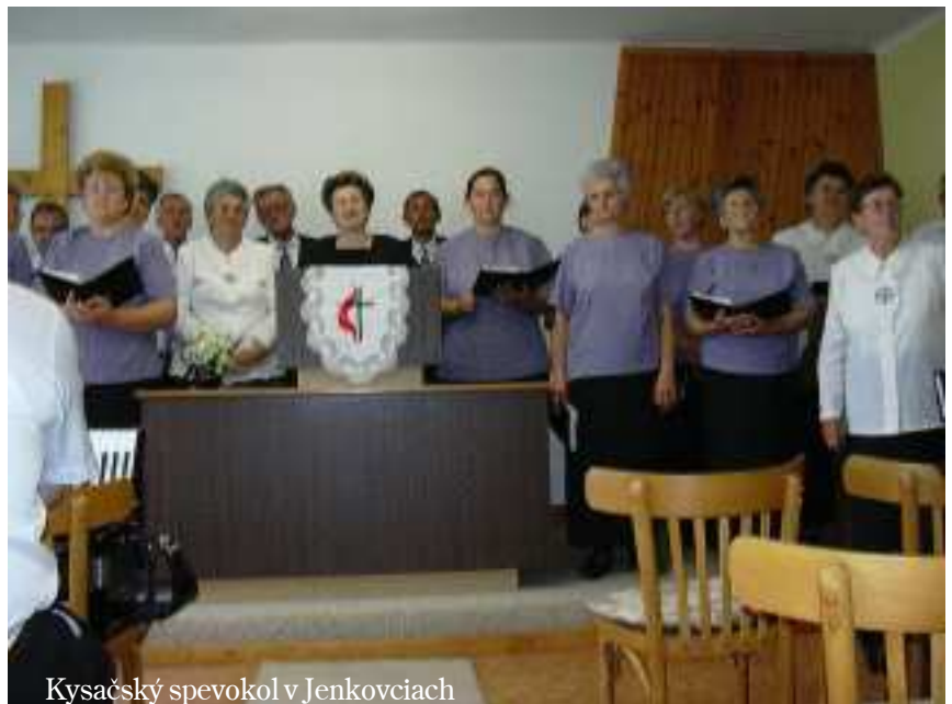
Kysačský spevokol v Jenkovciach

/nabudúce o hudbe v starozmluvnom chráme/ DANA ŠIRKOVSKÁ