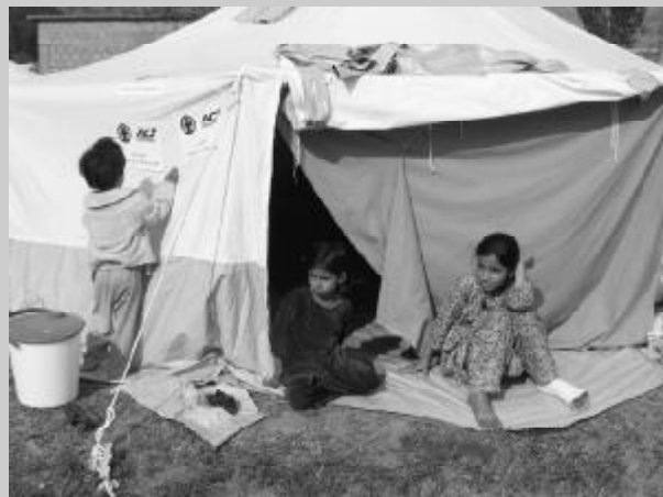
Foto: Dieťa chce vedieť, kto mu pomohol

Ľudová banka, 4000346704/3100. Variabilný symbol: 20051008