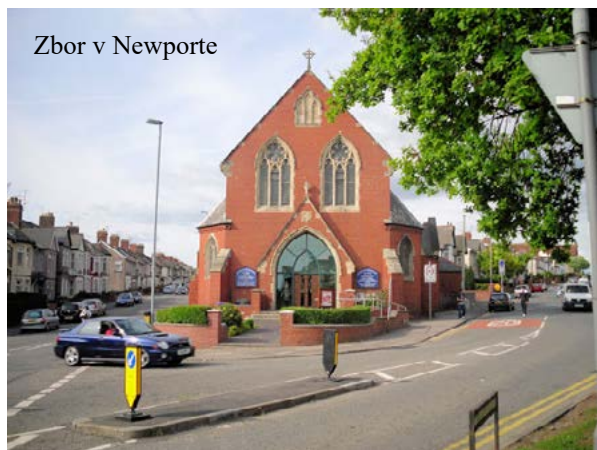
Zbor v Newporte

V tejto súvislosti ma zaujala pomerne bohatá expozícia z Johnovej liečiteľskej praxe. Vlastne som sa v našej cirkvi ani príliš nestretol s tým, ako hojne používal pri návštevách chorých tzv. domáce lieky. Veľa prednášok som počul o charizmatike, modlitbách, meditácii a iných duchovných dôrazoch, ale táto vo svojej dobe a prostredí určite veľmi užitočná súčasť Johnovej pastoračnej práce príliš zmieňovaná nebola. Nejde o to, že dnes máme na to odborníkov, ale o to, čo všetko bol schopný pri svojej činnosti obsiahnuť. Dve skrine naplnené škatuľkami s čajmi a fľaštič-