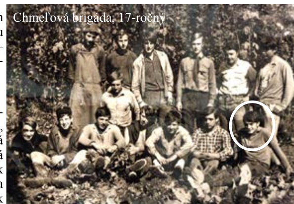
Chmelová brigáda, 17-ročný

Odkazujem čitateľom, že ich mám rád a že bez nich by bol môj život chudobnejší. A tiež prosbu: „Žite v láske, ako aj Kristus miloval nás a vydal samého seba za nás ako dar a obeť Bohu príjemnej vône.“ (Ef 5,2)