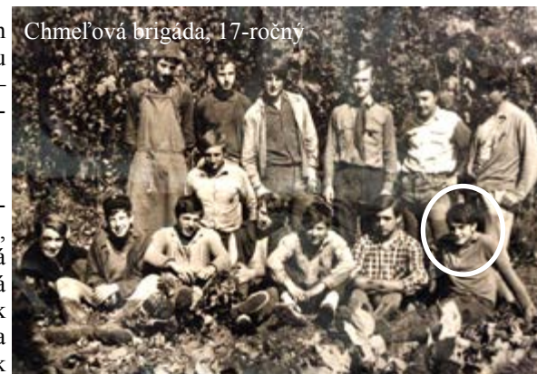
Chmel'ová brigáda, 17-ročný

Odkazujem čitateľom, že ich mám rád a že bez nich by bol môj život chudobnejší. A tiež prosbu: „Žite v láske, ako aj Kristus miloval nás a vydal samého seba za nás ako dar a obeť Bohu príjemnej vône.“ (Ef 5,2)